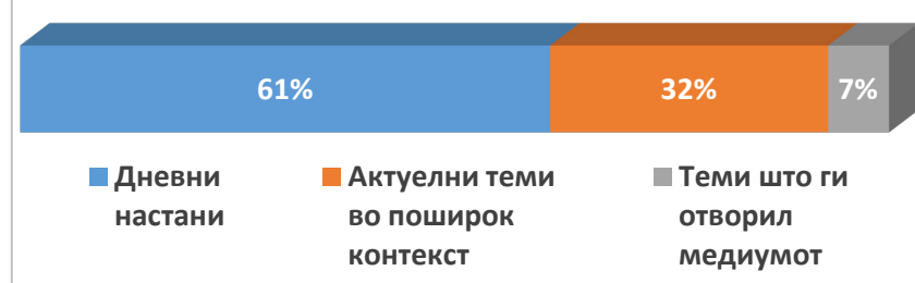
Графикон 2: Редакциски ангажман во известувањето

Меѓу телевизиите можеа да се забележат значителни разлики во новинарскиот ангажман при известувањето. Кај некои ангажираните прилози беа исклучително ретки. Кај други тие беа почести поради практиката да се прошируваат дневните извештаи со бекграунд и со поширокиот контекст, а кај трети ангажираноста се сведуваше на силен коментаторски израз со субјективни гледишта.