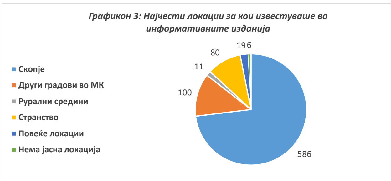
Графикон 3: Најчести локации за кои известуваше во информативните изданија

Сопствени стории и анализи од другите градови во Македонија објавуваа телевизиите ТВ Алфа („Седиштето на Правниот факултет се враќа во Битола“, 23.2.2018; „Тврдината Исар може да биде туристичка атракција“, 24.2.2018), ТВ Алсат-М („Општинскиот совет во Тетово, политички заробеник“, 25.2.2018), ТВ Канал 5 („Со Еразмус+ програмата до подобрување на квалитетот